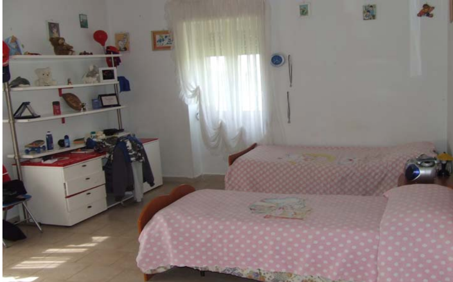
Foto 2.2 - Le camere da letto