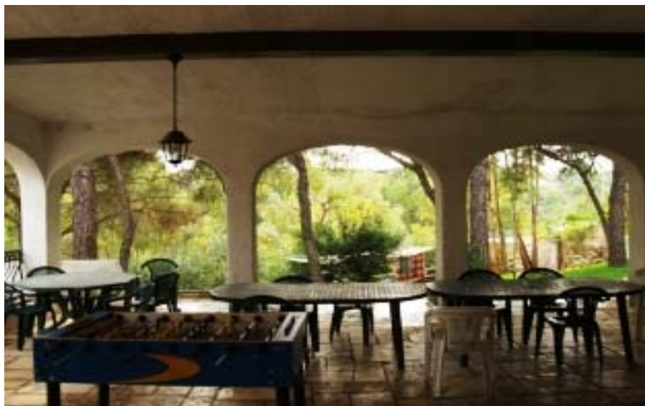
Foto 3.1 - Visuale esterna della struttura