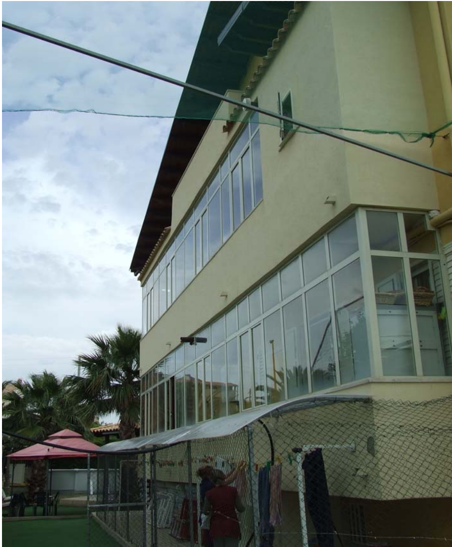
Foto 4.1 - Visuale esterna della struttura