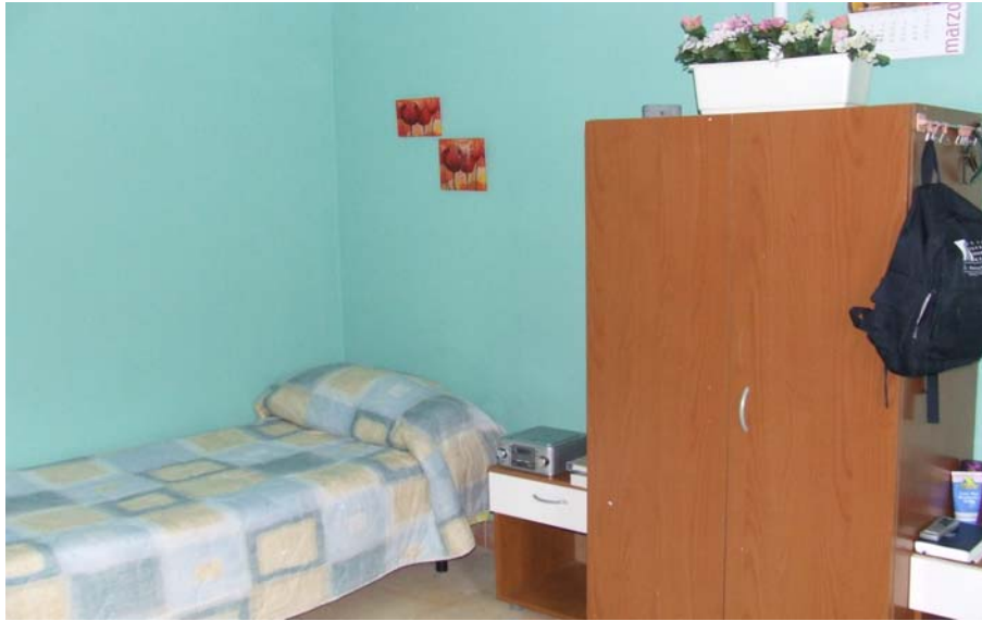
Foto 5.2 - Le camere da letto