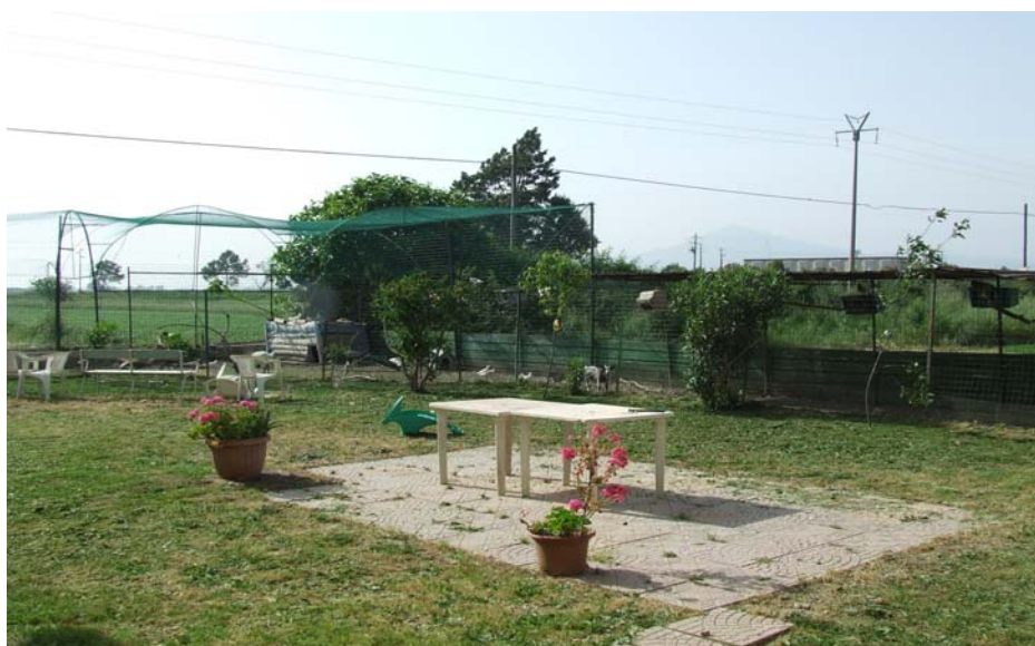
Foto 2.1 - Visuale esterna