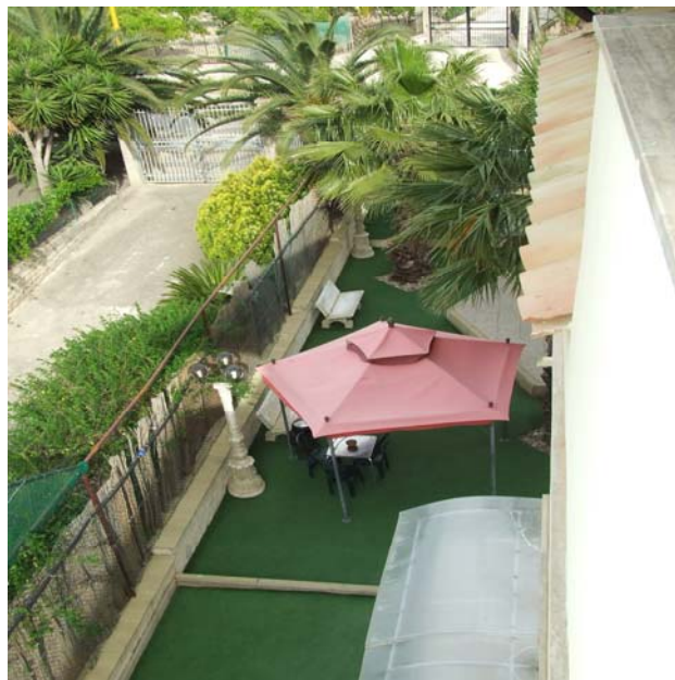
Foto 4.7 - Spazio adibito ad attività comuni