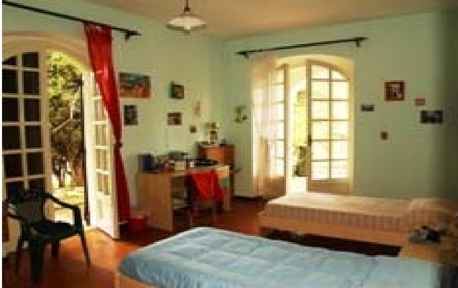
Foto 3.2 - Le camere da letto