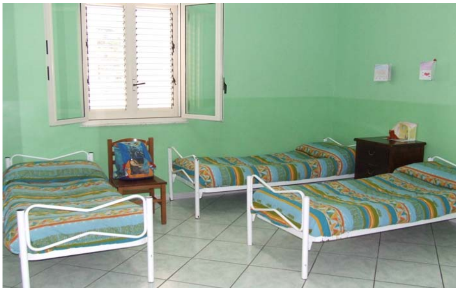
Foto 4.3 - Le camere da letto