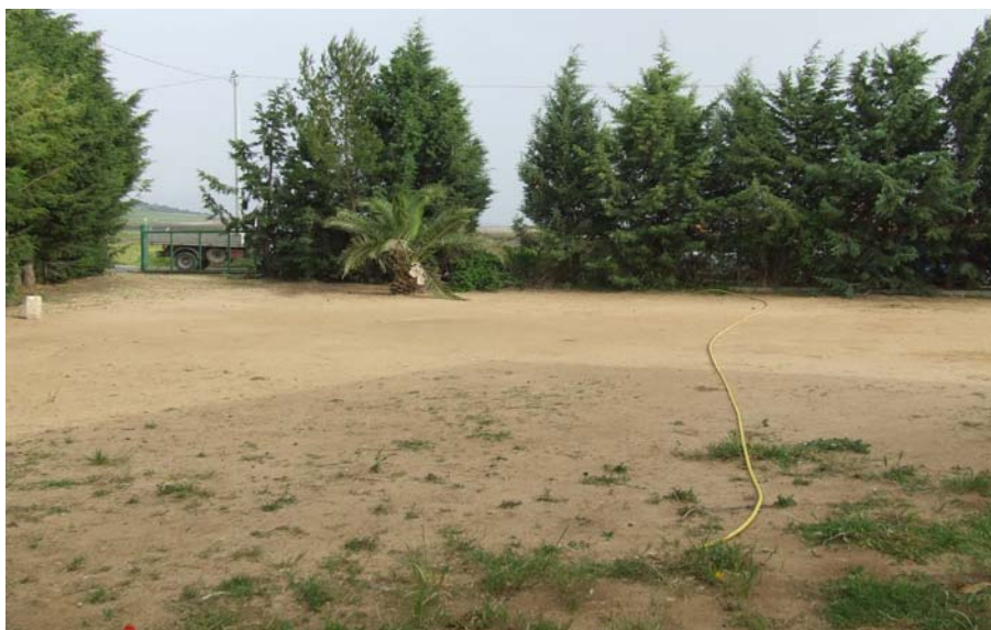
Foto 5.1 - Visuale esterna della struttura