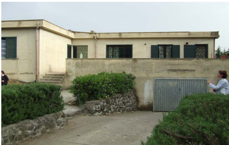
Foto 5.0 - La struttura

vengono svolti corsi di italiano, attività fisico-ricreative e attività di ricordo con la cultura d'origine.