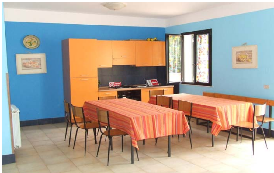
Foto 5.5 - Spazio adibito ad attività comuni