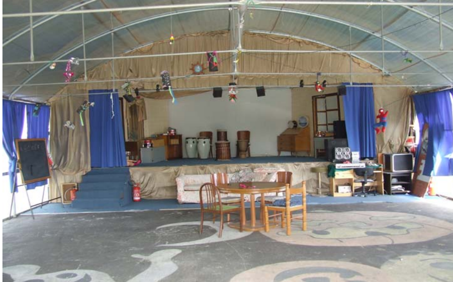
Foto 2.4 - Spazio adibito ad attività comuni