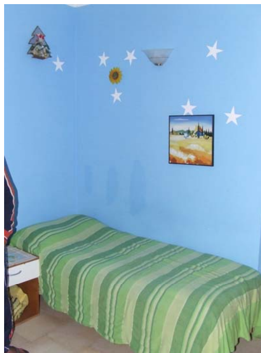
Foto 5.3 - Le camere da letto