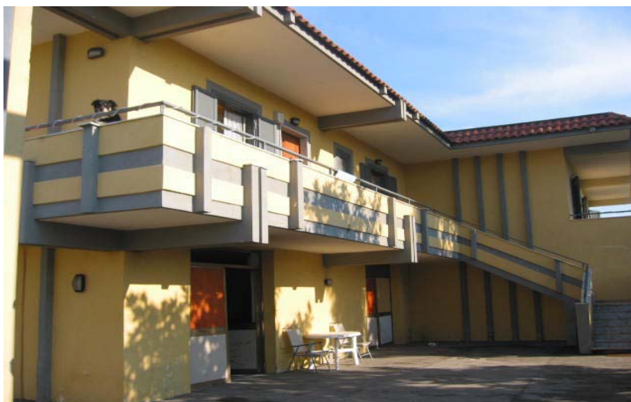
Foto 1.0 - La struttura

Il principale problema segnalato dai vari operatori è rappresentato dalla mancanza di risorse adeguate, causata sia dall'assenza di un accreditamento a livello regionale, sia dai ritardi da parte dei Comuni nel pagamento delle rette.