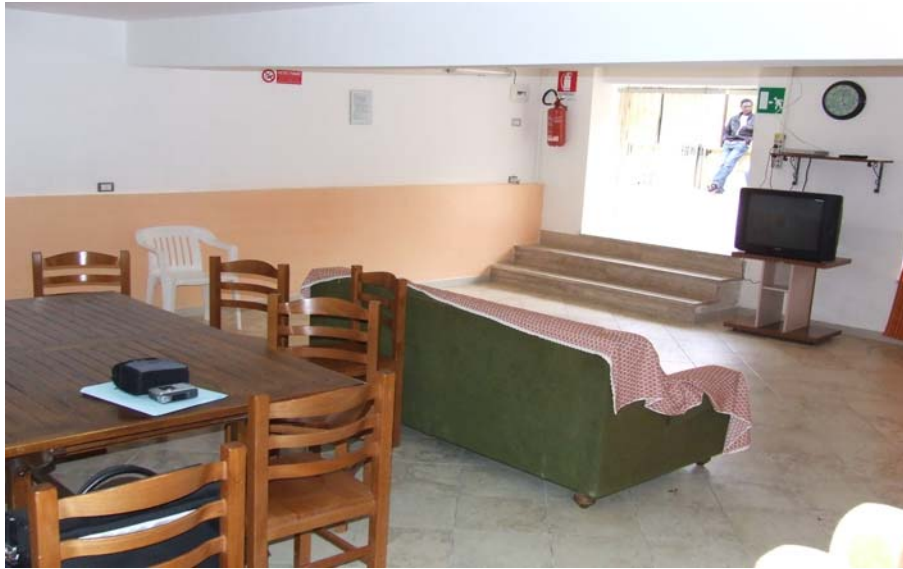
Foto 4.6 - Spazio adibito ad attività comuni