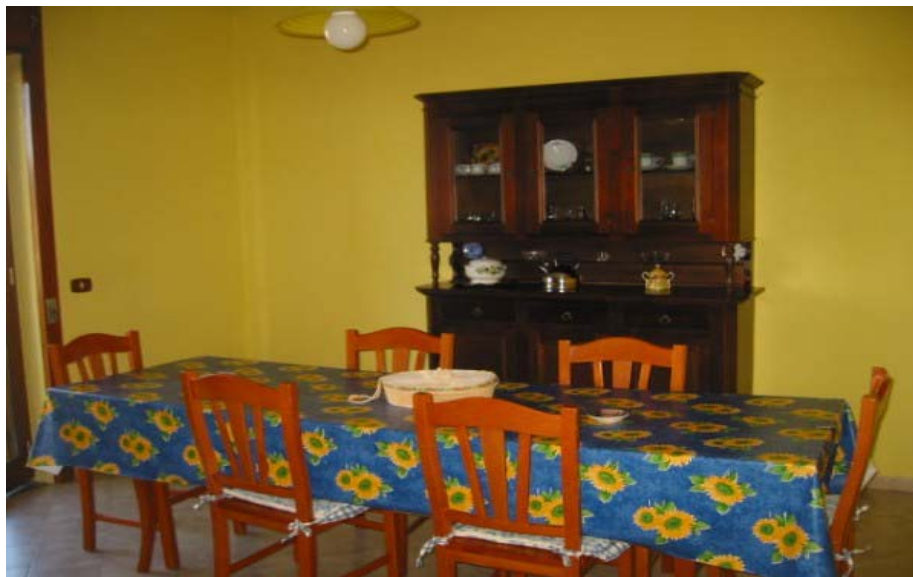
Foto 1.5 - Spazio adibito ad attività comuni