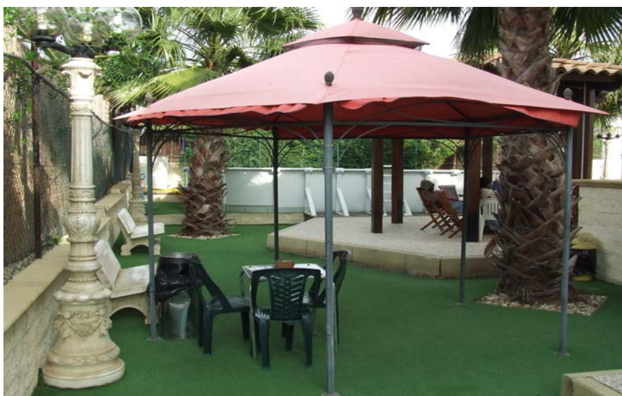
Foto 4.0 - Visuale esterna della struttura

La principale difficoltà riscontrata dai responsabili risulta essere la carenza di risorse finanziarie, in quanto le rette comunali non vengono pagate dall'anno 2005. Per far fronte a tale situazione, la struttura ricorre a prestiti contratti con istituti bancari.