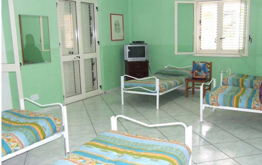
Foto 4.2 - Le camere da letto