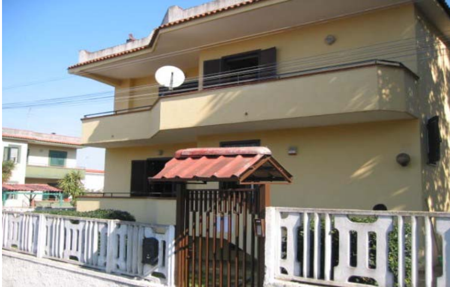
Foto 1.1 - Visuale esterna della struttura