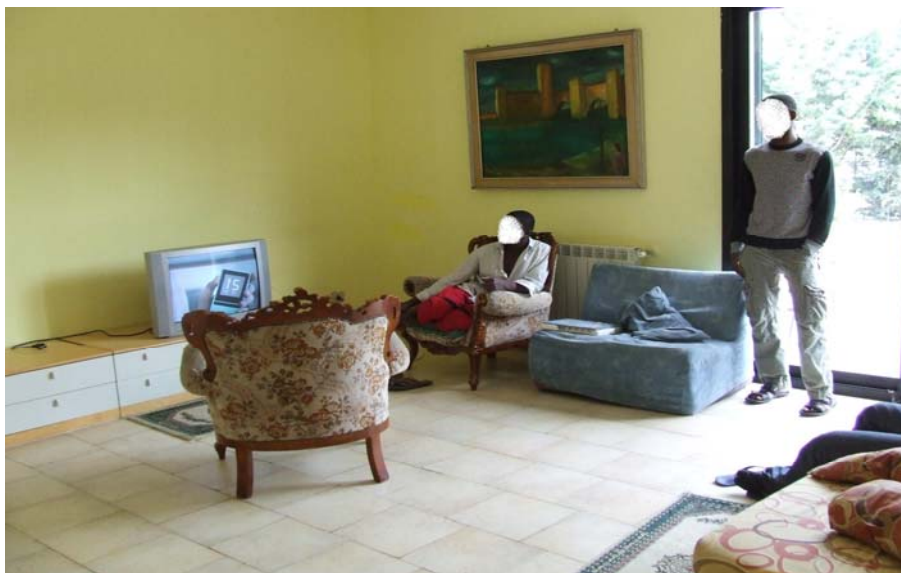
Foto 5.4 - Spazio adibito ad attività comuni