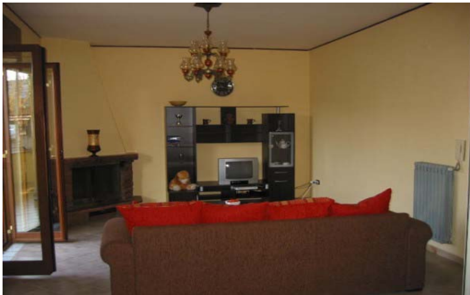
Foto 1.4 - Spazio adibito ad attività comuni