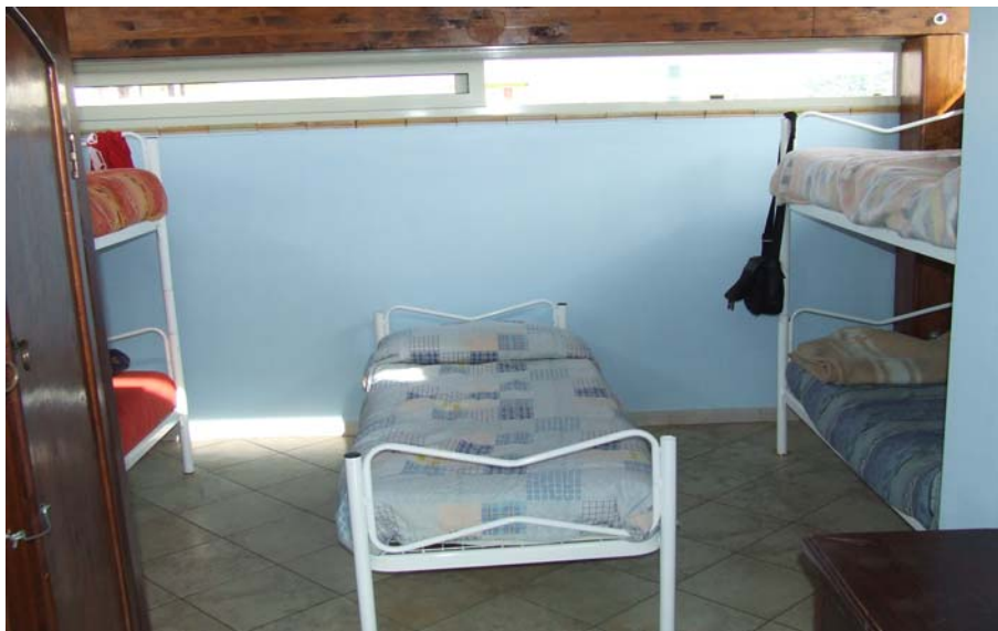
Foto 4.5 - Le camere da letto per le emergenze