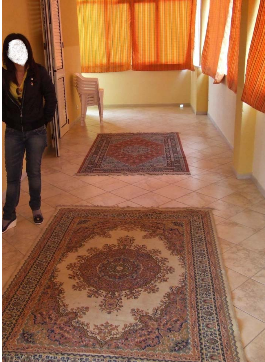
Foto 4.8 - Spazio adibito alla preghiera