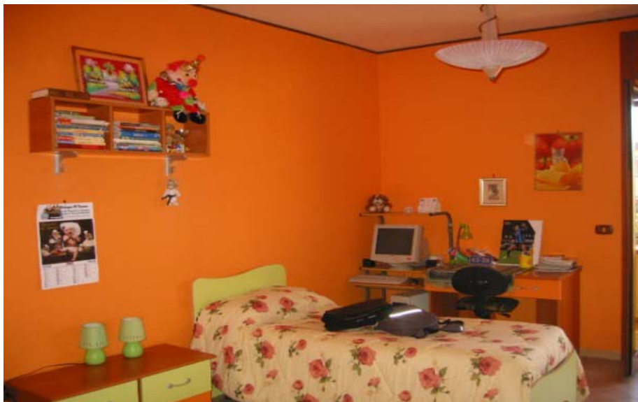
Foto 1.2 - Le camere da letto