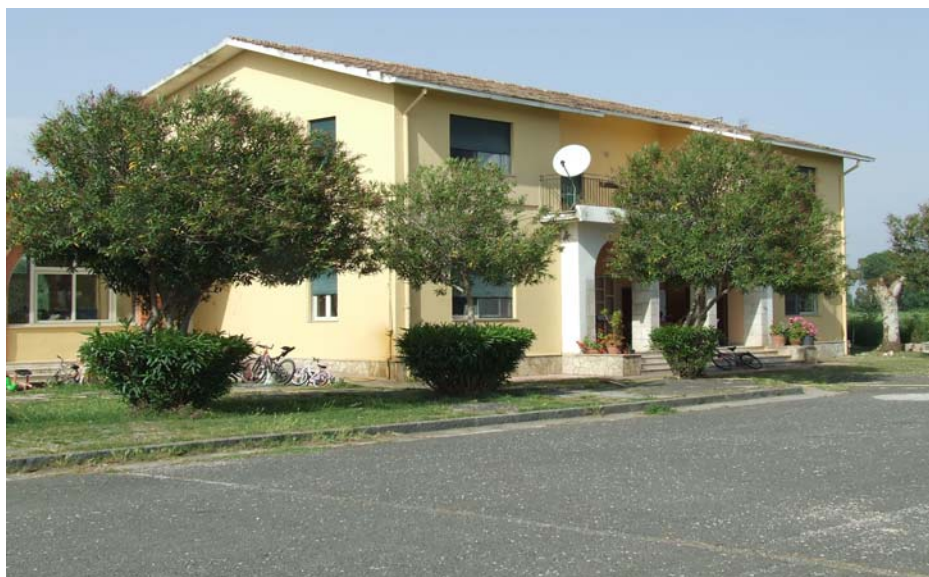
Foto 2.0 - La struttura

inadeguate al mantenimento del minore, non vengono rimborsate dall'anno 2007.