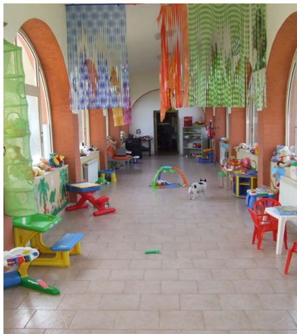
Foto 2.5 - Spazio adibito ad attività comuni