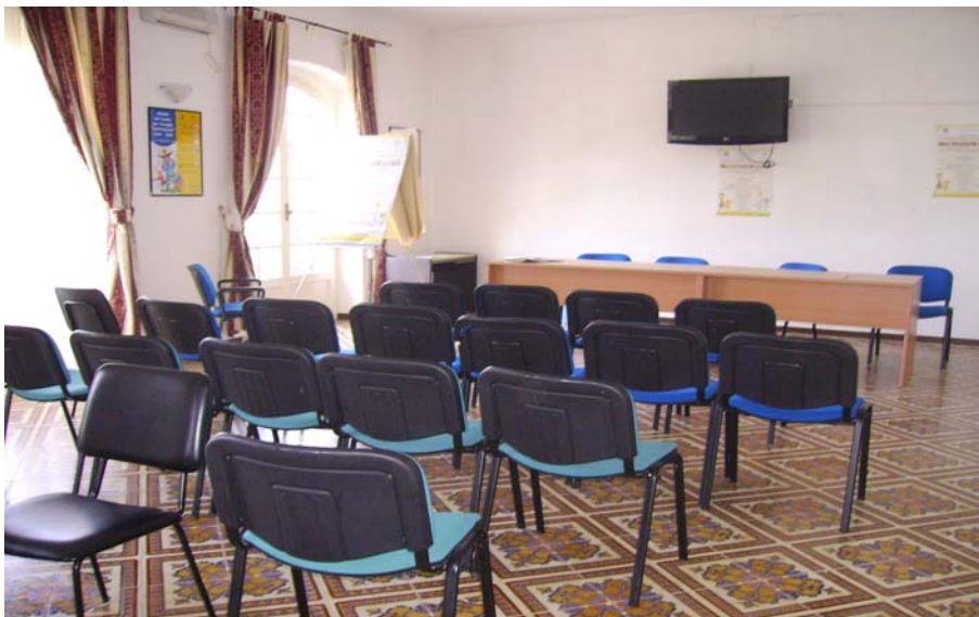
Foto 3.3 - Spazio adibito ad attività comuni