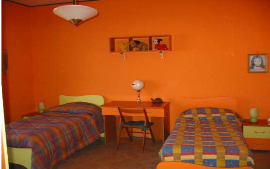
Foto 1.3 - Le camere da letto