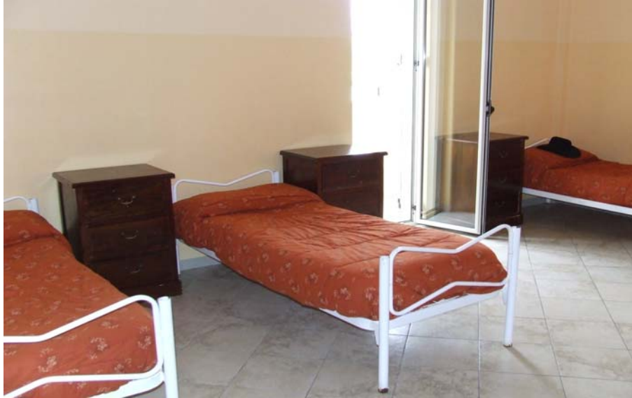
Foto 4.4 - Le camere da letto per le emergenze