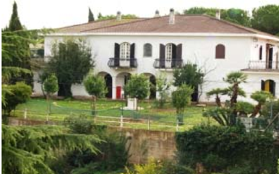
Foto 3.0 - La struttura